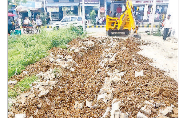
बराड़ा। अवैध कॉलोनी में निर्माण को तोड़ते हुए जेसीबी।