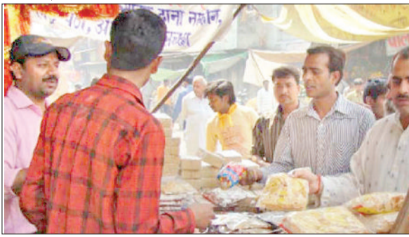
यमुनानगर। नवरात्र के पूर्व संध्या पर दुकानों पर खरीददारी करते श्रद्धालु।

आदि शक्ति जगत जननी मां जगदंबा के वीरवार से शुरू हो रहे चैत्र नवरात्र पर्व की पूर्व संध्या पर बुधवार को श्रद्धालुओं ने नारियल व पूजा का सामान खरीदा। इस दौरान दुकानों पर श्रद्धालुओं की