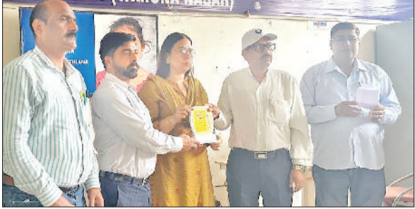
यमुनानगर। सरकारी स्कूल जटलाना में आयोजित कार्यक्रम में भाग लेते शिक्षक।

■ राजकीय वरिष्ठ माध्यमिक विद्यालय में आयोजित हुई बैठक ■ एफएलएन के अंतर्गत चार खंडीय शिक्षण स्तर मौखिक भाषा विकास पर कार्य करने की जरूरत