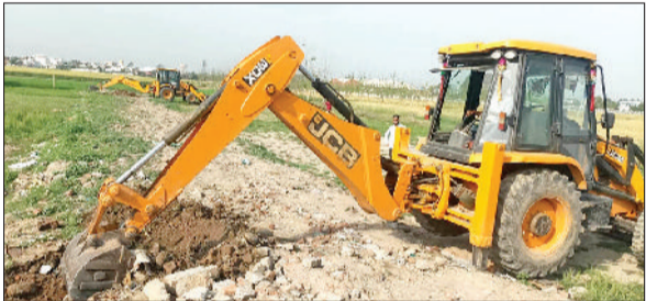
यमुनानगर। अनाधिकृत कालोनी में अवैध निर्माण पर चलता पीला पंजा।