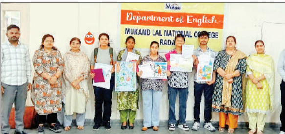
रादौर। प्रतियोगिता में भाग लेते विद्यार्थी।