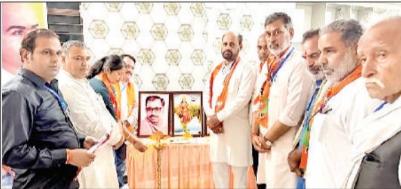
रादौर। प्रशिक्षण कार्यक्रम में भाग लेते भाजपा नेता व कार्यकर्ता।