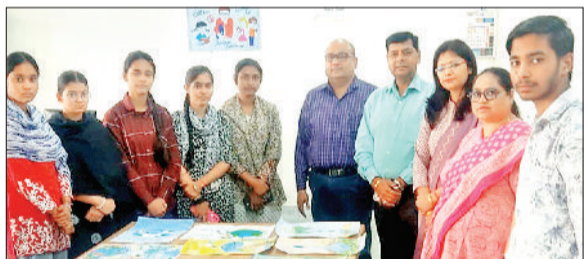
रादौर। सरकारी कॉलेज में आयोजित कार्यक्रम में भाग लेते विद्यार्थी।